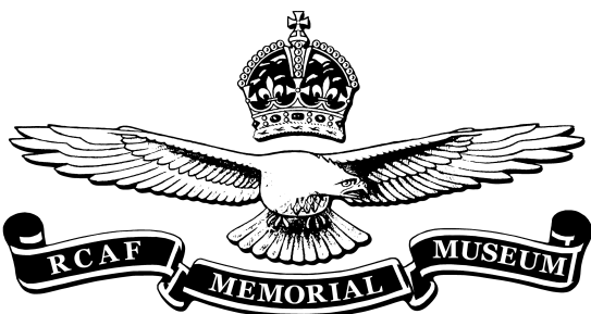
Musée national de la Force aérienne du Canada

Des photos des dalles sont disponibles sur demande. Indiquer votre préférence : Format numérique ____, format film ____.